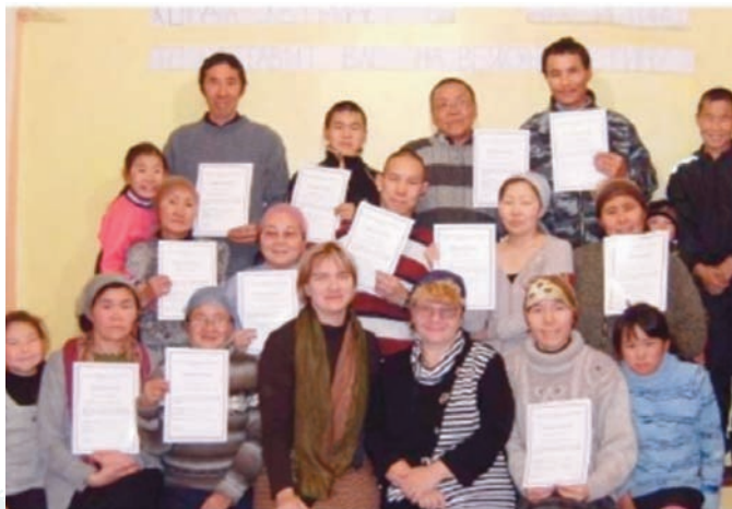
Tutores recién calificados en la iglesia de Evensk

Al amanecer del día siguiente, supimos que nuestro vuelo de regreso desde Evensk se había retrasado y no saldría hasta el día siguiente. Al principio nos sentimos sobresaltados, pero entonces nos dimos cuenta de que Dios nos había dado una oportunidad para completar la tarea que nos había enviado a realizar.