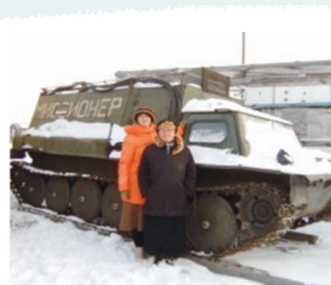
Al vehículo todoterreno de la iglesia se lo conoce como ¡"El Misionero"!