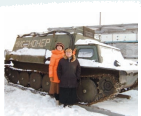
Al vehículo todoterreno de la iglesia se lo conoce como ¡"El Misionero"!