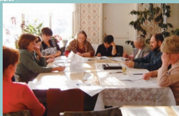
Seminario de formación de tutores en