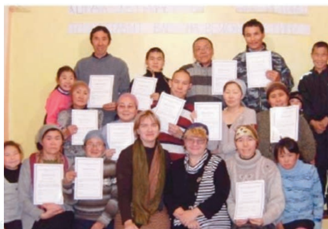
Tutores recién calificados en la iglesia de Evensk

Al amanecer del día siguiente, supimos que nuestro vuelo de regreso desde Evensk se había retrasado y no saldría hasta el día siguiente. Al principio nos sentimos sobresaltados, pero entonces nos dimos cuenta de que Dios nos había dado una oportunidad para completar la tarea que nos había enviado a realizar.