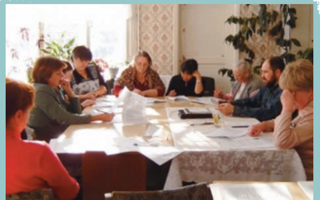
Seminario de formación de tutores en