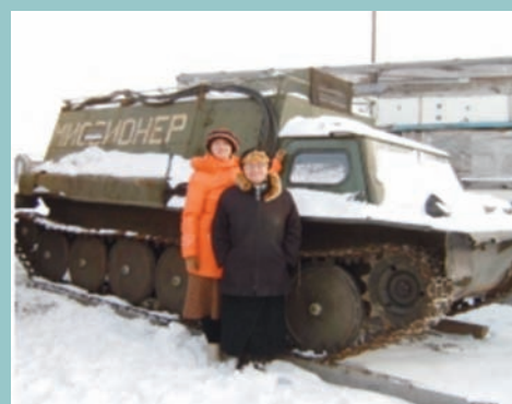
Al vehículo todoterreno de la iglesia se lo conoce como ¡"El Misionero"!

Llegamos a Magadan y tuvimos apenas 20 minutos antes de abordar nuestro vuelo a Vladivostok, pero