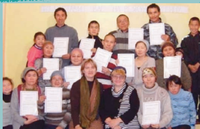
Tutores recién calificados en la iglesia de Evensk

Al amanecer del día siguiente, supimos que nuestro vuelo de regreso desde Evensk se había retrasado y no saldría hasta el día siguiente. Al principio nos sentimos sobresaltados, pero entonces nos dimos cuenta de que Dios nos había dado una oportunidad para completar la tarea que nos había enviado a realizar.