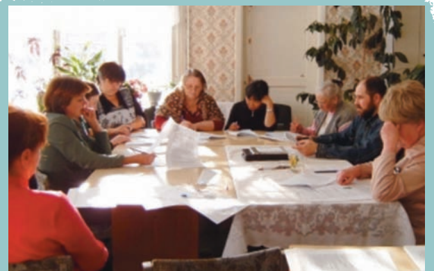
Seminario de formación de tutores en