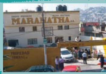
La iglesia Maranatha en el día de la ceremonia de graduación.

Esta fue el cálido saludo, con abrazo incluido, con que fui recibido en el modesto pero eficiente departamento que sirve de oficina al ministerio que representa a SEAN en México.