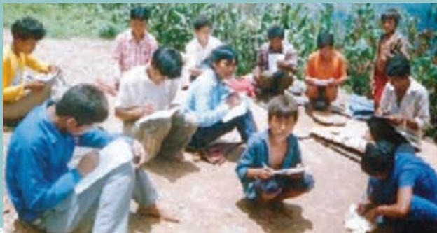
Los estudiantes más jóvenes de los cursos ITEEN rinden su examen final

Los cursos ITEEN no sólo han ayudado a los pastores en su ministerio sino también han fortalecido la fe de los creyentes. Ahora asisten a la iglesia con más regularidad y con el paso de los años ha crecido el número de cristianos en el pueblo.