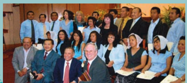
La ceremonia de graduación

Estuve completamente de acuerdo. ¡Pude comprobarlo con mis propios ojos!