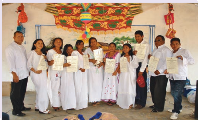
El primer grupo de pastores y líderes guajiros graduados.