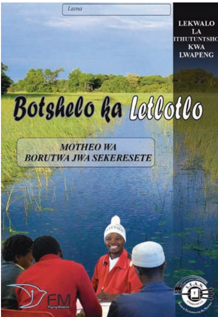
Vida Abundante en el idioma setsuana

Hace 6 años, la organización misionera Flying Mission (Misión Volante) firmó un acuerdo con SEAN para usar sus cursos en Botswana en los idiomas inglés y setsuana. Nos complace haber recibido recientemente las siguientes noticias de su parte: