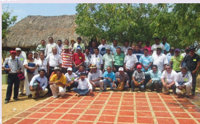
Los pastores guajiros en el congreso en que se formó la 'Asociación Pastoral Guajira'.

El objetivo es ayudar a cien pastores guajiros a completar los 4 años de estudio y gradúen a fines del 2014.