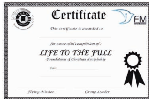
Una muestra del certificado otorgado una vez superado el curso

CURSOS —Para información sobre SEAN o cursos en los diferentes idiomas, contáctese con nosotros en: contacto@seaninternacional.com