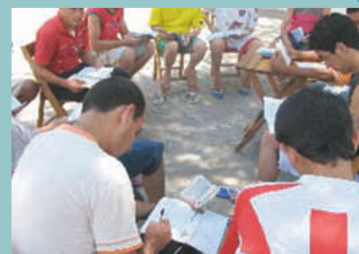
Tiempo de estudio con material de SEAN