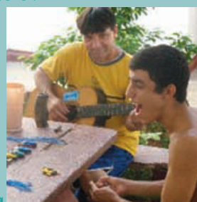
Un tiempo de alabanza mientras hacemos manualidades