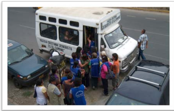
Estudiantes saliendo a evangelizar