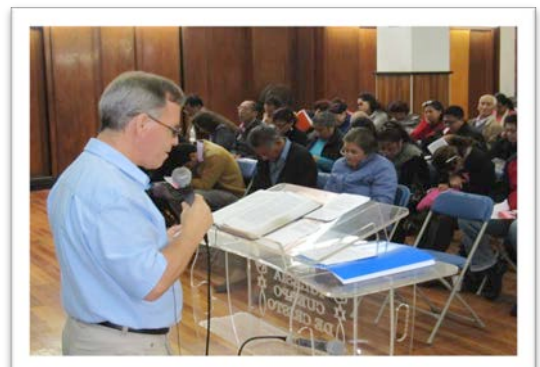
Una conferencia seminario