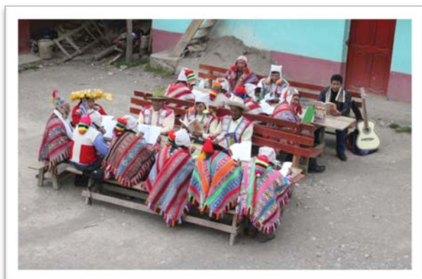
Un grupo de estudio en Tinke, Cuzco (Sur)