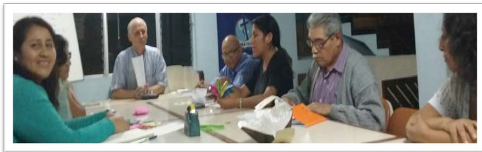
Un taller de capacitación de Tutores