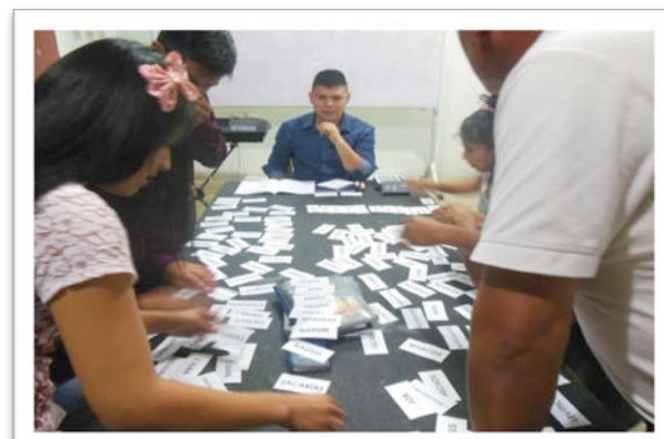
Un grupo de estudio en Pacanguilla (Norte)